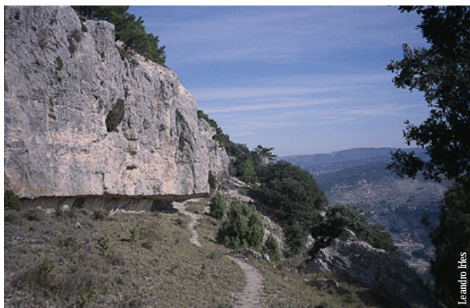
Mola de la Garumba