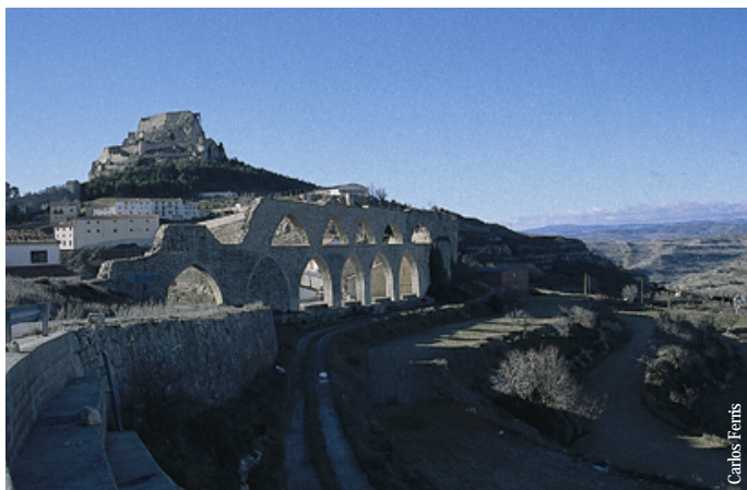
Aqüeducte de Morella